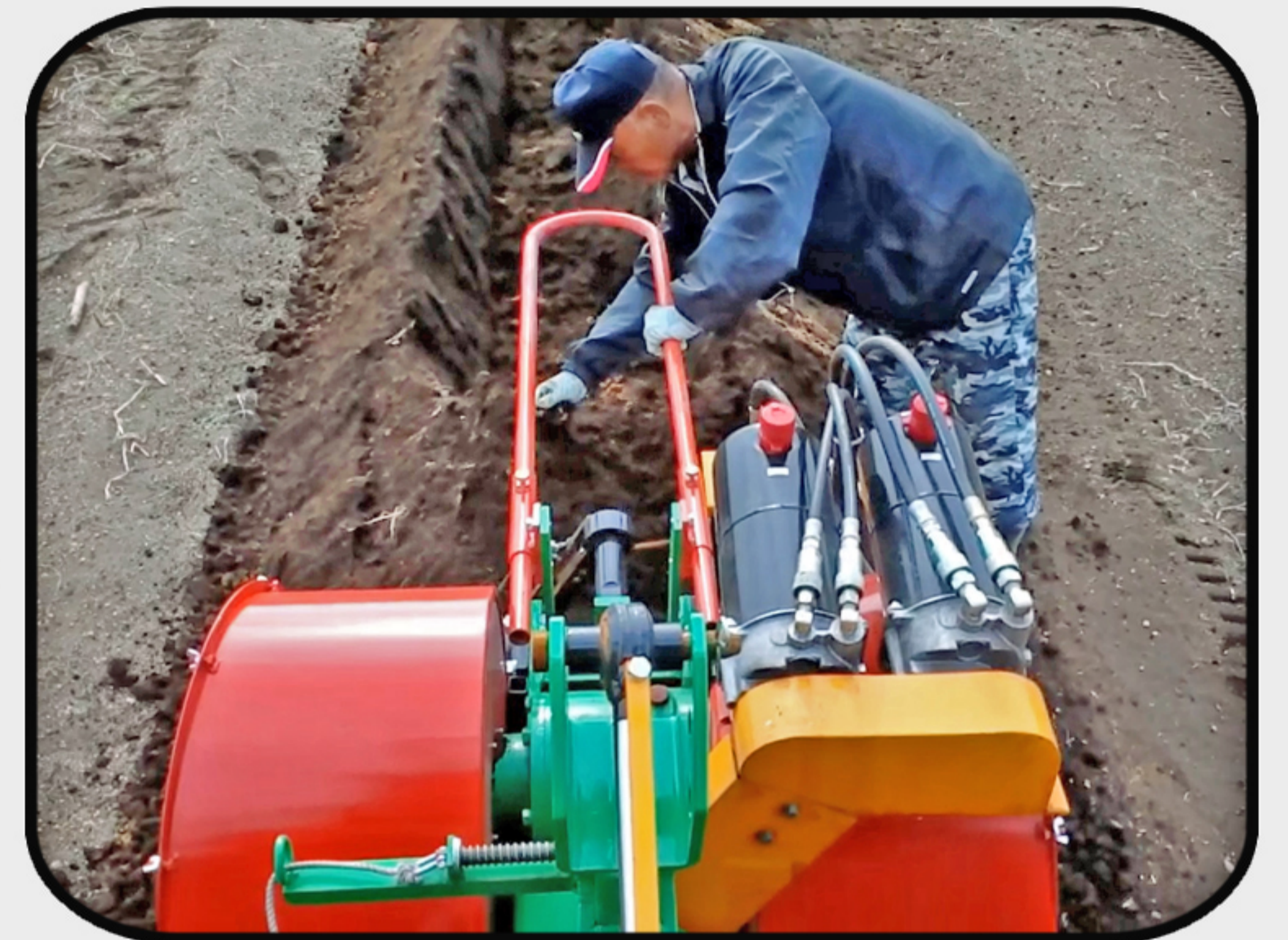
オペレーターからの視界良好